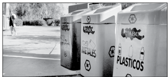
Una cultura del reciclaje se pretende inculcar a los bajacalifornianos por parte de la empresa Plastiton en diversas colonias de la ciudad.